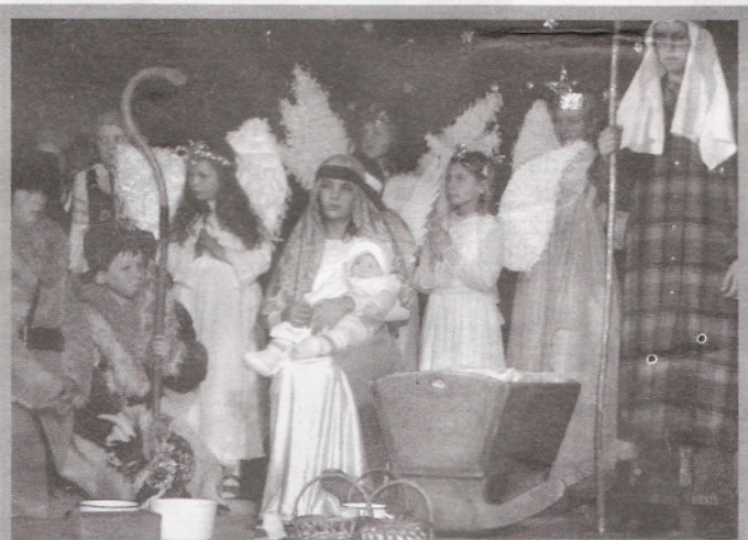
Żywe „dzieciątko” w jasełkach Szkoły Podstawowej w Majdanie Sieniawskim.

to wyróżniła: SP w Szówsku, SP nr 7 w Jarosławiu, teatry „Promyczek” i „Wiercipiętki” z SP nr 6, SP w Majdanie Sieniawskim, ZS w Dąbrowicy, ZS w Wierzbniej, SP w Siennowie, Gimnazjum Sióstr Niepokalanek w Jarosławiu oraz dwie jarosławskie szkoły średnie – ZSTiO i ZSOiO.