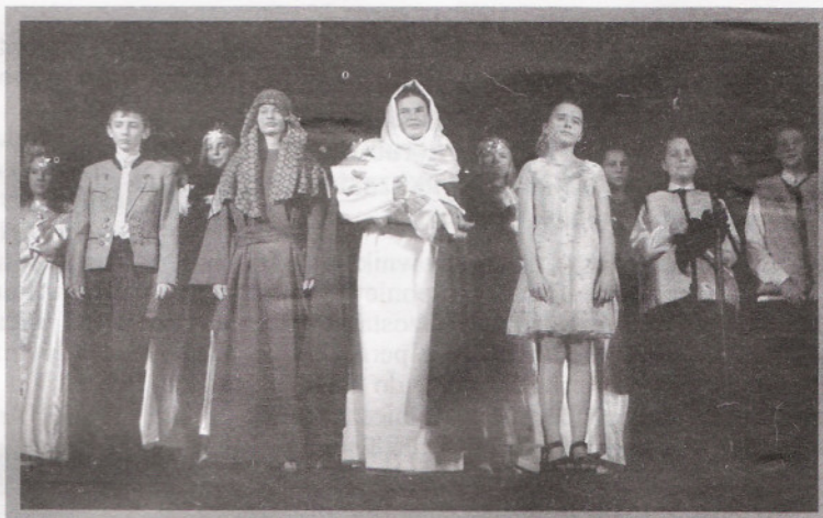
Scena finałowa przedstawienia Gimnazjum SS. Niepokalanek.