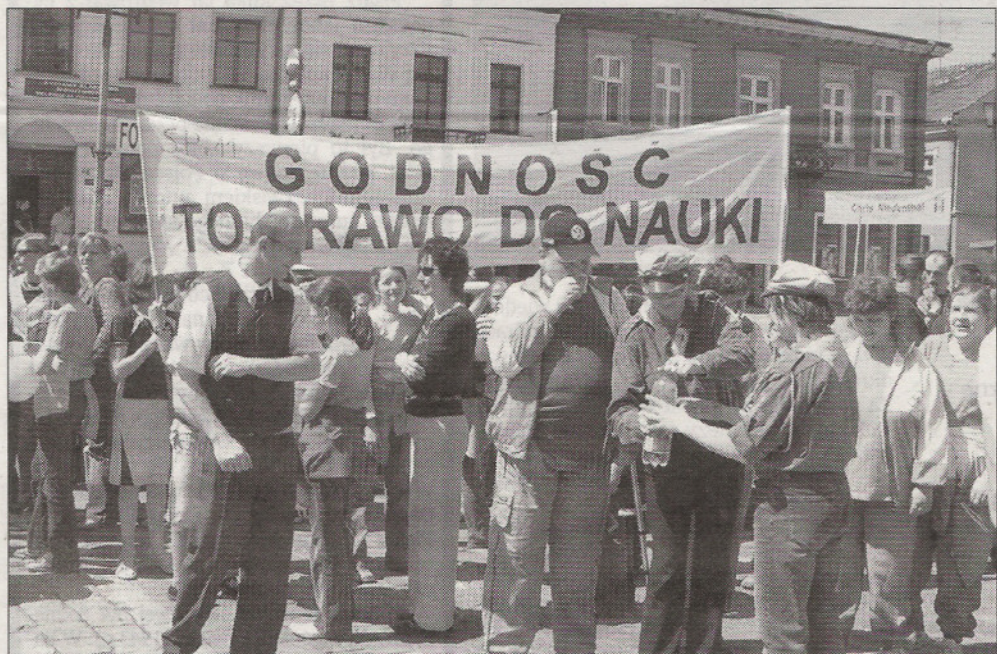
Setki osób uczestniczyły w przemarszu ulicami Jarosławia, który zakończył się na Rynku

Blisko tysięcy osób przemaszowało wczoraj ulicami Jarosławia z okazji Dnia Godności Osoby z Niepełnosprawnością Intelektualną i Europejskiego Dnia Walki z Dyskryminacją Osób Niepełnosprawnych.