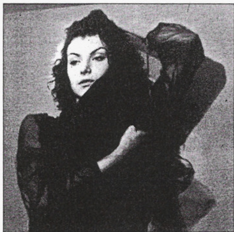
Jedna z prac Jerzego Jartyma